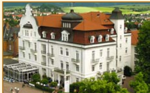
Göbel's Hotel Quellenhof 34537 Bad Wildungen Tel. 05621 807-0 www.goebels-quellenhof.de