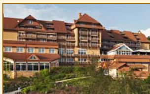
Göbel's Hotel Rodenberg 36199 Rotenburg a. d. Fulda Tel. 06623 88-1100 www.goebels-rodenberg.de