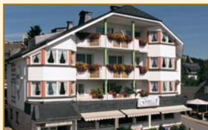
Göbel's Landhotel 34508 Willingen Tel. 05632 987-0 www.goebels-landhotel.de