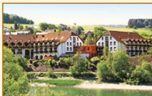
Göbel's Seehotel Diemelsee 34519 Diemelsee-Heringhausen Tel. 05633 9931-0 www.hotel-diemelsee.de