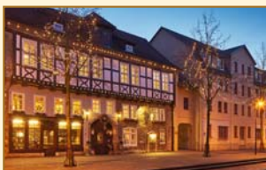
Hotel Brauhaus Zum Löwen 99974 Mühlhausen/Thüringen Tel. 03601 471-0 www.brauhaus-zum-loewen.de