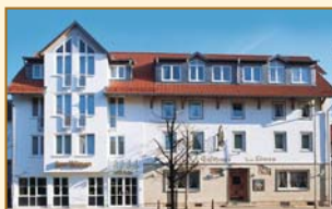
Göbel's Hotel Zum Löwen 36289 Friedewald b. Bad Hersfeld Tel. 06674 9222-0 www.goebels-hotel-zum-loewen.de