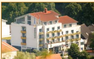
Posthotel Rotenburg 36199 Rotenburg a. d. Fulda Tel. 06623 931-0 www.posthotel-rotenburg.de