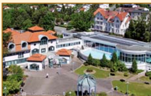
Göbel's Hotel AquaVita + QuellenTherme 34537 Bad Wildungen-Reinhardshausen Tel. 05621 786-0 www.goebels-aquavita.de