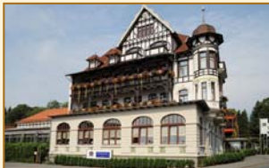
BEST WESTERN PLUS Göbel's Vital Hotel 37441 Bad Sachsa/Harz Tel. 05523 9438-0 www.vitalhotel.de