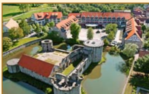
Göbel's Schlosshotel 36289 Friedewald b. Bad Hersfeld Tel. 06674 9224-0 www.goebels-schlosshotel.de